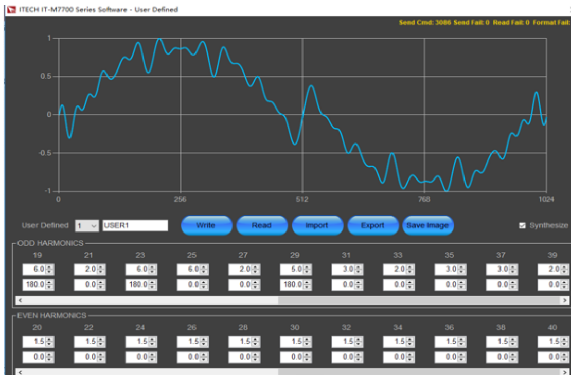
图 3 IT-M7700 谐波模拟示意图