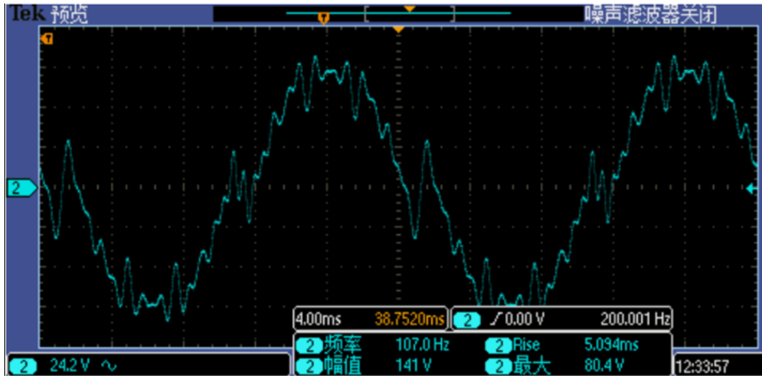
图 4 IT-M7700 谐波模拟示波器图

除此之外，IT-M7700 交流电源还支持 AC+DC 模式可实现直流电压偏移模拟，可设置输出波形起始/停止相位角，突波陷波 Surge/Trap 功能。那么我们同样可以在 list 模式下将谐波模拟，陷波，直流电压偏置做一个序列变化。例如，在谐波模拟每个周期的 90° 角 us 级别的陷波跌落，另外，在此基础上做一个电压偏置，如下图 5 所示。