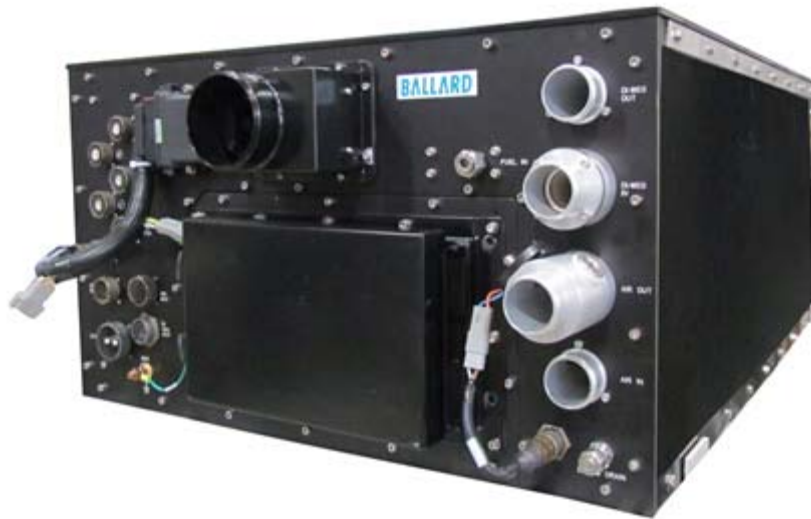
图一、燃料电池电堆（又称燃料电池发动机）

新能源汽车以其节能、环保、高效的概念成为未来汽车发展的一大方向。在大众的视野中，纯电动汽车还是一个新兴的事物，而日本、美国、欧洲的许多汽车厂家已经开始氢燃料电池汽车的发展规划。在我国，未来纯电动和插电混合动力汽车补贴将大幅退坡，但燃料电池汽车的补贴额度保持不变且高于电动车。这样的政策激励催生了燃料电池汽车的快速崛起。