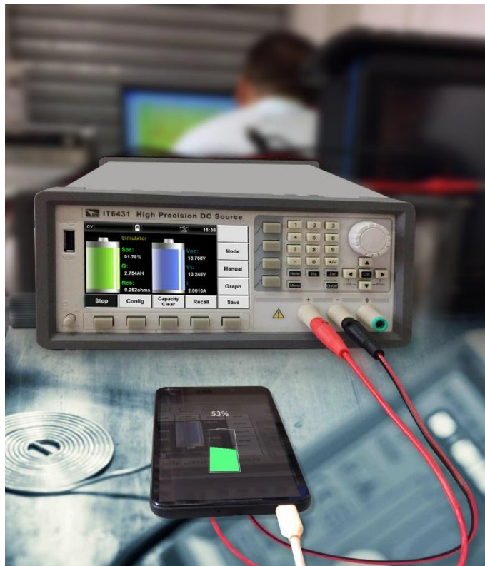
图 3 IT6431 Simulator 功能实际测试图

艾德克斯 IT6400 系列直流电源，其优越的电池特性模拟功能尤其适用于便携式电池供电产品的测试，高达 1nA 的解析度，小于 20us 的超快动态响应时间，和速度切换模式，可让电压或电流的上升波形高速且无过冲。同时，用户还可通过波形显示功能实现示波器的体验，让使用更加简易便捷。该产品已被广泛应用于便携式电池供电产品、移动电源、LED 产品测试等各个领域。